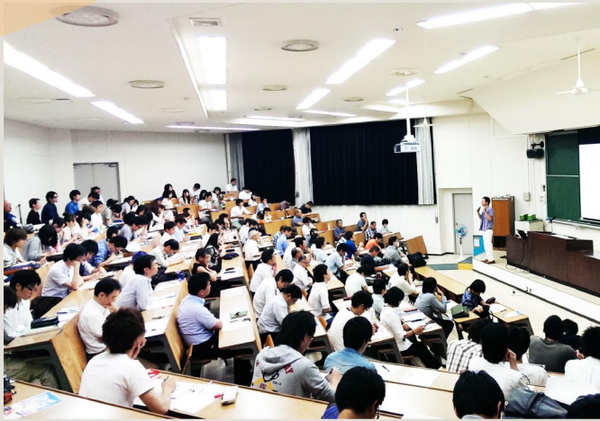
福島大学での「公開講座」の講義風景。農業・農学のテーマを中心に組み立て、熱気ある講義が続きました。

2013年度から、本プログラムの主催により福島大学・郡山市役所を両会場として公開講座を開催し、学生、行政関係者、農業・食料産業関係者など多数のご参加をいただいています。本プログラムの大学院生は、公開講座を履修し、積極的にディスカッションに参加しています。